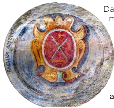
Stemma della Famiglia Baschenis, Antica via porticata, Averara

Da luglio a ottobre, amanti dell'arte e della cultura, ma anche della natura e dei sapori del territorio, potranno partecipare a iniziative, percorsi e progetti nati grazie alla collaborazione degli 11 comuni dell'Alta Valle Brembana e di numerose realtà locali.