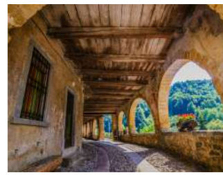
Via Porticata - Averara

La guida, curata da Giovanni Valagussa, è stata pensata per consentire a tutti gli appassionati e amanti di cultura del territorio di conoscere e apprezzare la produzione di questi artisti, che si sono tramandati l'arte dell'affresco per quattro generazioni. Suddivisa per itinerari (Bergamo, Valle Brembana, Valle Seriana, e Dintorni di Bergamo), è completa della mappa con i percorsi e delle schede descrittive, arricchite da immagini a colori delle opere e dei luoghi che da secoli le custodiscono.