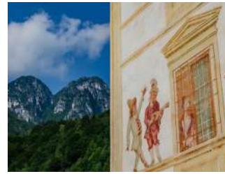
Serenata Macabra - Cassiglio